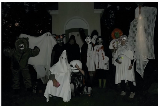
Bytosti ze stezky odvahy v Níkovcích u kapličky