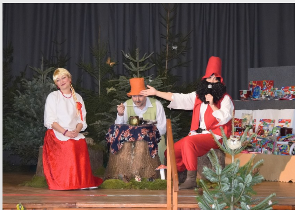
Představení členů kulturní komise na karnevalu v Hrejkovicích