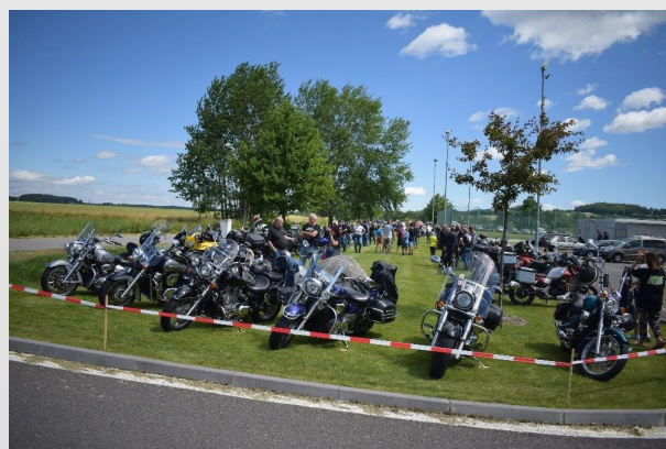
V Hrejkovicích na hřišti proběhne již IV. motogrilování